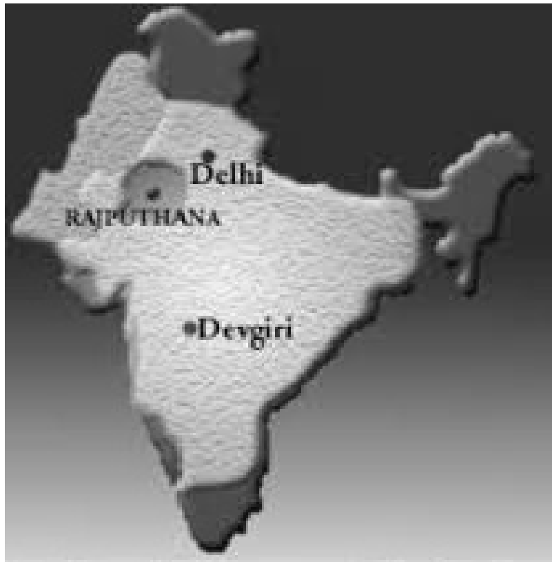
ମହମ୍ମଦ-ବିନ ତୁଗଲକଙ୍କ ସାମ୍ରାଜ୍ୟ (ଖ୍ରୀ. ୧୩୨୧-୧୩୫୧)

କାରଈଲ ଅଭିଯାନର ସାମାନ୍ୟ ପୂର୍ବରୁ ମହମ୍ମଦ ତୁଗଲକ ଖୁରାସାନ ବିଜୟ ପାଇଁ ଏକ ଉଚ୍ଚାଭିଳାଷୀ ଯୋଜନା ପ୍ରସ୍ତୁତ କରିଥିଲେ । ଏଇ ଉଦ୍ଦେଶ୍ୟରେ ୩,୭୦,୦୦୦ ସୈନ୍ୟଙ୍କର ଏକ ବିଶାଳ ବାହିନୀକୁ ନିୟୁକ୍ତି ଦିଆଯାଇ ସେମାନଙ୍କୁ ବର୍ଷକର ଦରମା ଅଗ୍ରିମ ପ୍ରଦାନ କରାଯାଇ ଥିଲା । ସୈନ୍ୟବାହିନୀ ପାଇଁ ମହାର୍ଦ୍ଧ ସରଞ୍ଜାମ କିଣିବାରେ ବହୁ ଅର୍ଥ ବିନିଯୁକ୍ତ ହୋଇଥିଲା । ପରେ କିନ୍ତୁ ଅବାସ୍ତବ ମନେକରି ପରିଯୋଜନାଟିକୁ ପ୍ରତ୍ୟାହାର କରାଗଲା ଏବଂ ସେନାବାହିନୀକୁ ଭାଙ୍ଗି ଦିଆଗଲା । ଏଥିରେ ଭୟଙ୍କର ଆର୍ଥିକ କ୍ଷତି ହେଲା । ସୁଲତାନଙ୍କ କର୍ତ୍ତୃତ୍ୱରେ ମଧ୍ୟ ଖୁର୍ ଆଞ୍ଚ ଆସିଲା । ଗୋଟିଏ ପରେ ଗୋଟିଏ ବିଦ୍ରୋହର ଲମ୍ବା ଧାଡ଼ି ଲାଗିଲା । ଫଳରେ ଦିଲ୍ଲୀ ସୁଲତାନୀ ଶାସନର ସର୍ବାଧିକ ବିସ୍ତୃତ ସାମ୍ରାଜ୍ୟଟି ଫମ୍ପା ହୋଇଗଲା ।