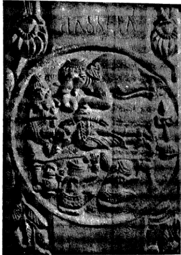
16. The Birth of Buddha

ବୁଦ୍ଧଙ୍କ ପ୍ରଥମ ପାଞ୍ଚ ଜଣ ଶିଷ୍ୟ ଥିଲେ ଅଶ୍ୱଜିତ, ଉପାଳି, ମୋଗଲ୍ଲାନ, ସାରୀପୁତ୍ର ଓ ଆନନ୍ଦ । ବୁଦ୍ଧ ମଧ୍ୟ ହେଉଛନ୍ତି ବୌଦ୍ଧ ସଂଘର ପ୍ରତିଷ୍ଠାତା । ତାଙ୍କର ସର୍ବାଧିକ ଉପଦେଶ ଶ୍ରୀବତ୍ସିରେ ପ୍ରଦତ୍ତ । ଶ୍ରୀବତ୍ସିର ଧନୀ ବଣିକ ଅନାଥପିଣ୍ଡକ ଥିଲେ ବୁଦ୍ଧଙ୍କ ଅନୁଗାମୀ ଏବଂ ସେ ଉଦାର ଭାବେ ସଂଘକୁ ଦାନ ଦେଉଥିଲେ ।