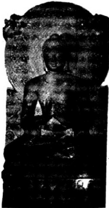
11. Preaching Buddha (Gupta Period)